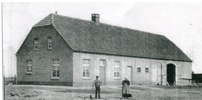
boerderij Arnoldus van den Elzen