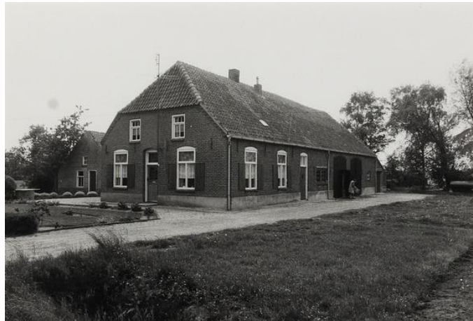
boerderij Rudolphus van Hoof Deze foto is niet van 1925