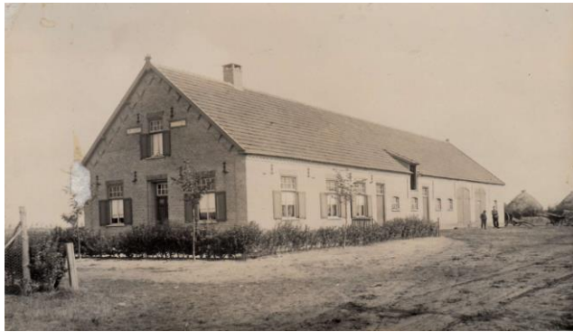
boerderij Gerardus Kroef