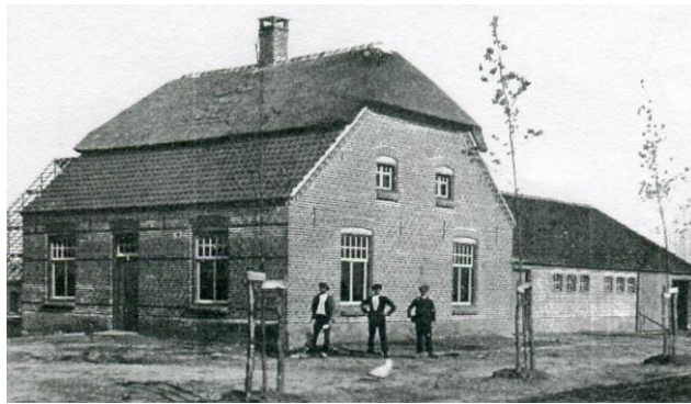
boerderij Martinus de Groot