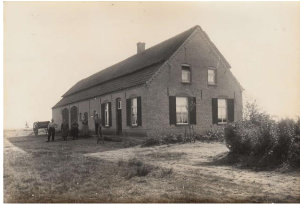
boerderij Hubertus Coppens