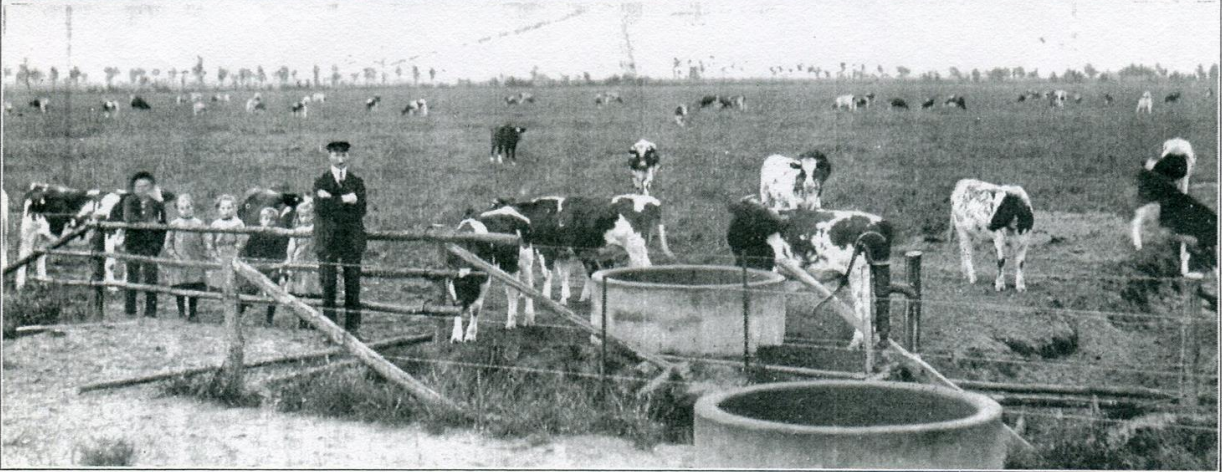
De Peel-ontginning in de gemeente Uden (N.-B.): boven stoomploeg der Ned. heidemaatschappij, die weidegrond ploegt op een diepte van 25 à 30, soms zelfs tot 50 c.M.; beneden gemeenteweide, 4 kampen van 10, dus totaal 40 H.A. ontgonnen heide; deze wordt thans jaarlijks beweid met 140 stuks vee en bracht het ontginningsbedrijf der gemeente Uden in 1925 een zuivere winst van \pm f 2400 en in 1926 een zuivere winst van \pm f 2600 op.