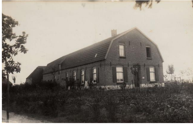
boerderij Michaël Pittens