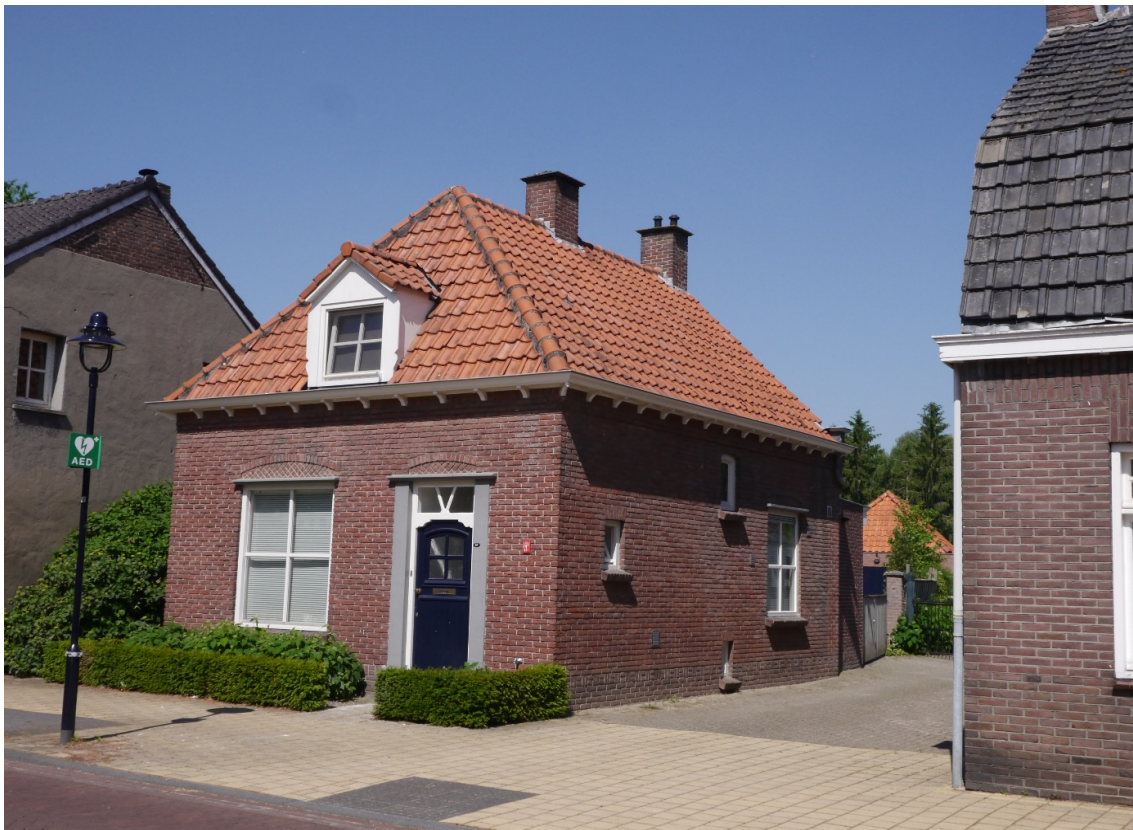
Woning familie van de Wetering in de 2 e wereldoorlog. Eerschotsestraat A340

Voor Wim met zijn militaire kennis, was het verhaal snel duidelijk: Mills komt 100% zeker uit een neergeschoten vliegtuig. Het gezin helpt hem op een bewonderenswaardige manier (eten, kleding, landkaart, voedselbonnen en geld). Ook werd Mills gewaarschuwd weg te blijven uit de buurt van Eindhoven, omdat daar veel Duitsers waren gelegerd. Dit in verband met het Duitse vliegveld wat zich daar bevond. Vervolgens helpen 3 broers hem een stukje op weg. Ze helpen hem diezelfde avond op eigen houtje Rooi uit, volgens Mills in zuidelijke richting. Hulp van het verzet was er niet, Mills zou dan immers nooit alleen op pad gestuurd zijn. Nu was het waarschijnlijk zijn redding en kon hij ongezien vluchten.