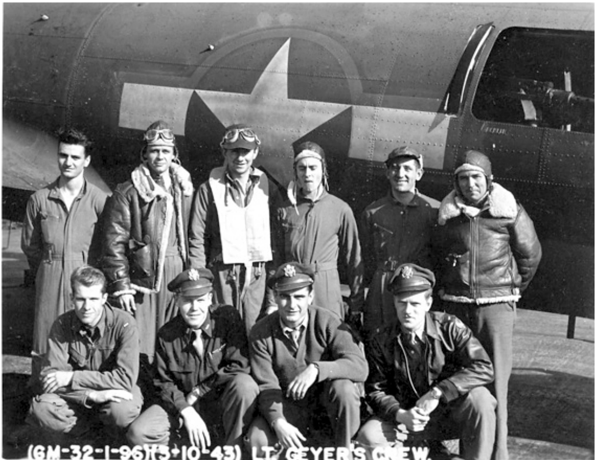
Bemanning van B-17 42-3439. Foto 3 oktober 1943.