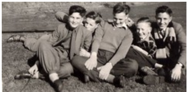
Dit mocht ik ook graag doen: GEK!