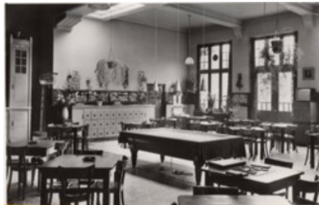
Recreatiezaal cour superieur

schreven op als we tekort kwamen, want dan hoefden we het spel niet af te geven. Ik was een expert in Stratego. Ook fineerden we. Wie weet nog wat dat is? Met behulp van een tekening sneed je verschillende dunne plakjes fineer van verschillende houtsoorten uit. Die moesten precies naast elkaar passen. Vervolgens werd die 'houten' tekening op een stuk triplex geplakt en onder een pers gelegd. Dat bleef er minstens een dag onder zitten. Dan moest je alles glad