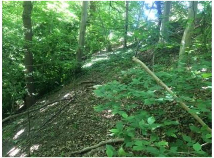
Pad naar boven richting Tuinderspad