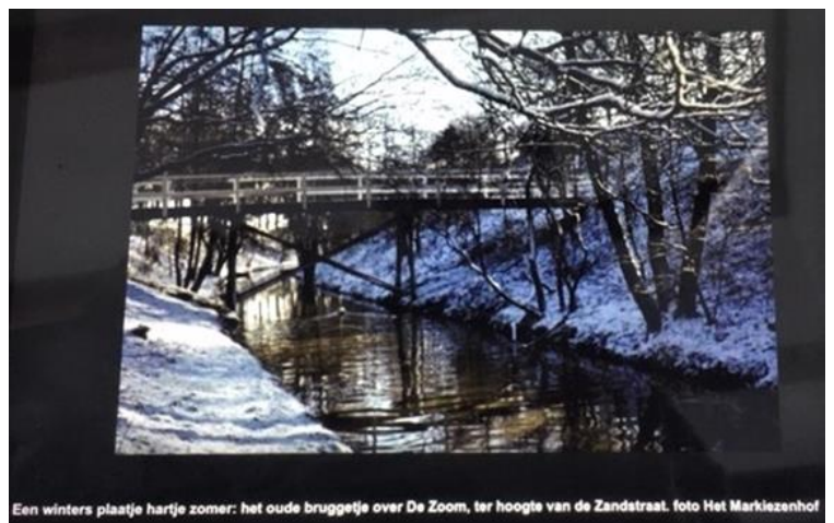
Een winters plaatje hartje zomer: het oude bruggetje over De Zoom, ter hoogte van de Zandstraat.

Links kaart Toporeis : groene pijl is het bruggetje ; TP = Tuinderspad, toen Tuinstraat, ZS = Zandstraat en OL = Van Overstratenlaan. Bij Van Overstratenlaan rechts naar beneden en aan overkant naar boven met keuzemogelijkheid naar Tuinstraat nu Tuinderspad of naar Zandstraat.