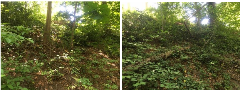
Zuidzijde van de Zoom naar boven