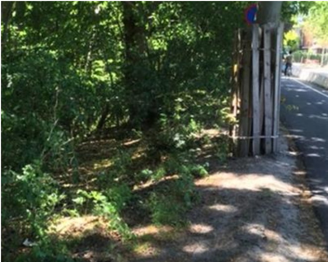
Pad vanaf de Zandstraat: links naast bomen