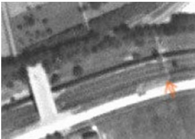
Foto links die later nog een keer wordt afgebeeld : wit over Zoom de betonnen brug van 1932. Bij rode pijl mogelijk een eerdere oversteek over smal pad en smalle stuw

De wens van een brug over de Zoom tussen de Zandstraat en de Van Overstratenlaan dateert van in ieder geval 1930. De brug is eerst in eind 1932 gerealiseerd. Mogelijk gebruikten de bewoners van de Zandstraat een smalle stuw in de Zoom als oversteek naar de stad.