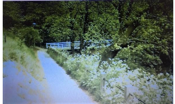
Onderaan links naar boven liep het pad naar de Zandstraat en over de brug rechts naar boven liep naar de Van Overstratenlaan.