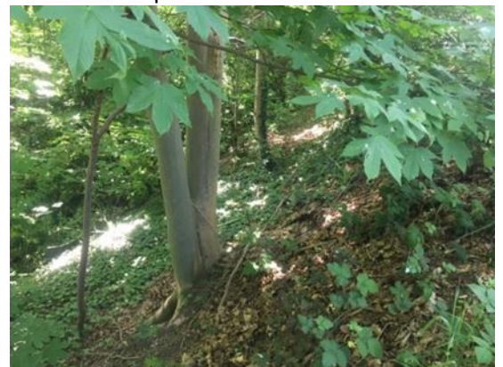
en vanaf fietspad