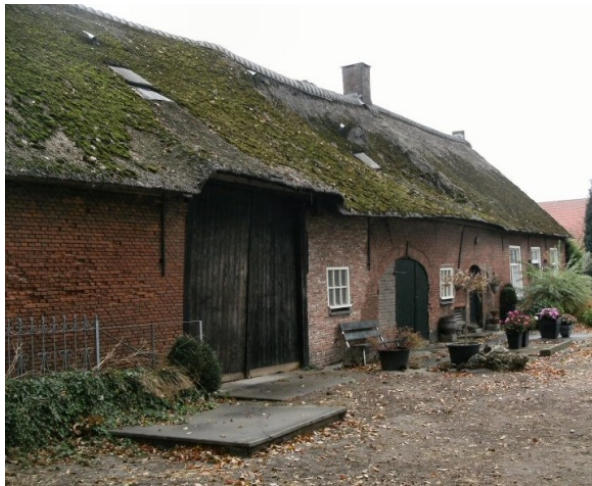
Voorbeeld van zo'n boerderij

Zoals al vermeld, het dossier van Jan Baptist bij de Jezuïeten was niet uitgebreid en er zaten alleen zaken in die te maken hadden met zijn verblijf in de orde. Er waren echter ook twee feestboekjes ter gelegenheid van zijn 50- en 60-jarig jubileum als kloosterling. De familie had in een aantal liederen zijn leven bezongen en dat geeft toch ook wel een goed beeld van zijn (jonge) leven, hoewel het wellicht enigszins “gekleurd” zal zijn.