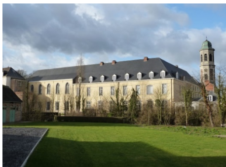
Abdy van Drongen

Drongen was indertijd een zelfstandige gemeente ten westen van de stad Gent in West-Vlaanderen. Thans maakt het deel uit van de gemeente Gent en omvat het westelijke deel van de stad. Sinds de negentiende eeuw hadden de Jezuïeten hier hun opleidingsinstituut voor jonge en aankomende Jezuïeten. (zie kader)