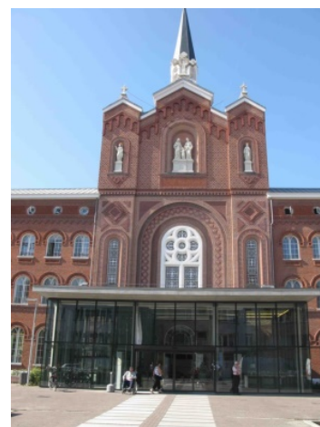
Ingang Sint Vincentius Gasthuis

Begin januari 1966 werd hij opgenomen in het Sint Vincentius gasthuis in Antwerpen, waar hij op 10 januari is overleden. Hij werd 83 jaar. Op 13 januari 1966 was de rouwdienst in de kerk van het Xaveriuscollege en daarna werd hij begraven op het kerkhof van Wilrijk. 11