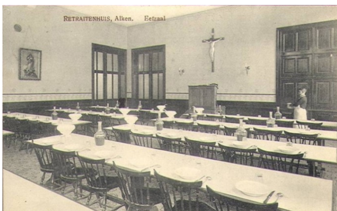
Eetzaal Retraitehuis Alken

Oorspronkelijk een herenhuis na 1846 gebouwd door dokter/heelmeester Joseph Simons. Na diverse bewoners/eigenaren kwamen in september 1904 de eerste Jezuïeten in het herenhuis wonen en werd het gebouw van dan af uitgebreid en omgebouwd tot retraitehuis. De Jezuïeten verwerven het pand in juni 1923. In november 1965 werd het verkocht aan de brouwerij van Alken.