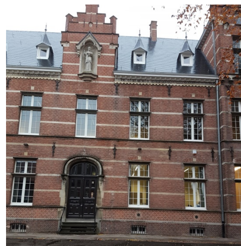
Ingang en deel van het oude Sint Jozefcollege in het centrum van Turnhout. Nu is het een kleuter en lagere school. Hier was ook de Apostolieken school. De straat het nu ook Apostoliekenstraat.