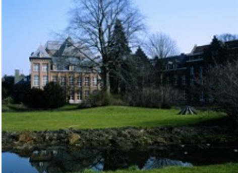
Jezuitenklooster van Lier

Er werd ook de nodige tijd gependeed aan de “4 experimenten” van Ignatius, zoals een tijd werkzaamheden verrichten in een ziekenhuis en hulp verlenen aan daklozen en andere hulpbehoevenden. Voor de Jezuiten was dat noviciaatshuis tot 1968 in Drongen. Nu is die voor Nederlandse en Belgische kandidaten in Birmingham (GB).