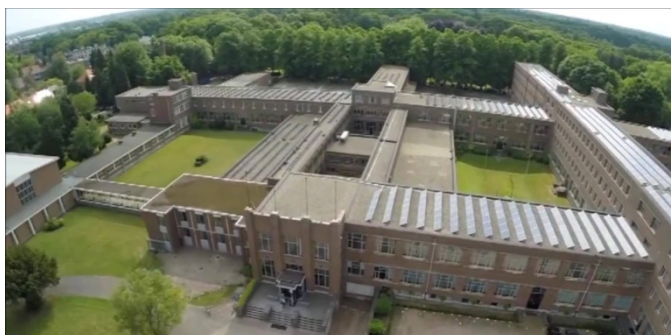
Huidige Sint Jozef college Turnhout. Zicht op de hoofdingang. De groenvoorzieningen achter de gebouwen horen bij het domein.

Maar dat kan ook een plagerijtje zijn geweest.