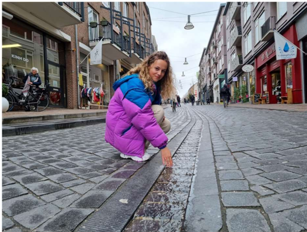
„Hé, het watergootje in de Stikke Hezelstraat stroomt weer!”

Ongetwijfeld zal men de oude Loint met zijsloten aantreffen in de bodem van het plangebied. Dat betekent vrijwel zeker enkele gevallen van sanering van de oude waterloop. Als er dan toch moet worden gegraven laat dan de oude geul op een of andere wijze terugkomen en vul deze in met een moderne schone variant.