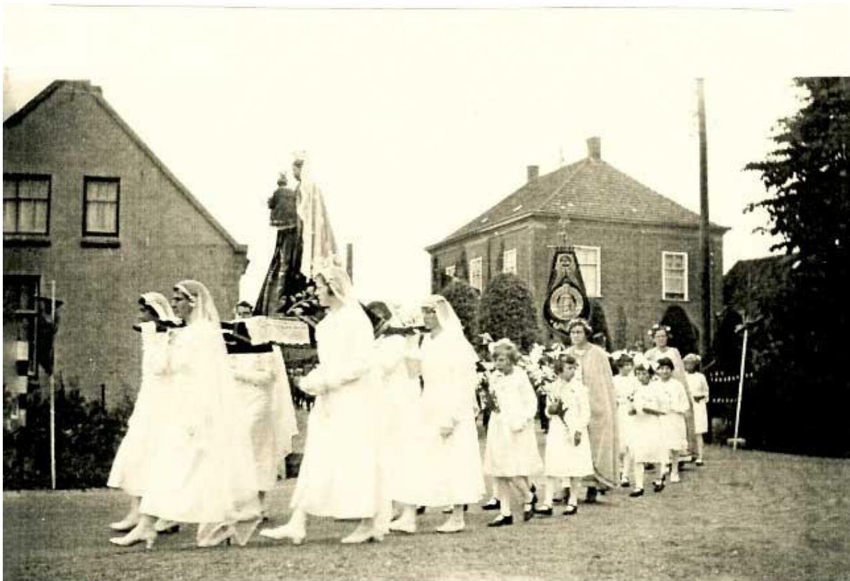
FOTO VAN PROCESSIE...V-D BREESTRAAT NAAR DE PERDSHEMEL MET MARIA-BEELD...11 JUNI 1936.

Die processie beperkte zich aanvankelijk tot een rondtrekken op het feest van Sacramentsdag, tien dagen na Pinksteren. Ook op de feestdag van de dorpspatroon werd wel processie gehouden. Tot ongeveer 1960 bleef dit op veel plaatsen zo voortduren, die processie trok dan meestal rond de kerk of door een processiepark, soms zelfs alleen maar in de kerk. Maar in Boxmeer en Sint Tunnis bleef het oude voorrecht bestaan en trok men door de straten. Denk aan de Vaartprocessies in Boxmeer. Tegenwoordig trekt die processie één keer door Boxmeer, een 50 jaar geleden was dat nog vier keer en sprak men terecht van de Vaartweek. Die Vaart trok heel veel pelgrims, ook uit Duitsland en natuurlijk ook uit het hele Land van Cuijk en ook uit de omgeving van Nijmegen.