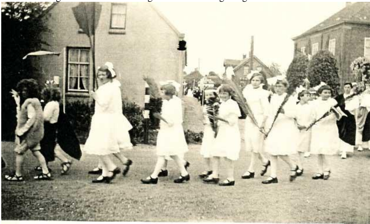
FOTO VAN PROCESSIE..V-D BREESTRAAT NAAR DE PERDSHEMEL MET MARIA-BEELD...11 JUNI 1936.

Hier en daar zag je in de kerk mensen van de harmonie zitten met hun instrument en zo was de hele kerk al in 'processiestemming'. Het was natuurlijk een grote teleurstelling voor velen als de pastoor of vicaris op de preekstoel bekendmaakte dat de processie vanwege slecht weer niet door kon gaan. Alle voorbereidingen waren dan vergeefs geweest.