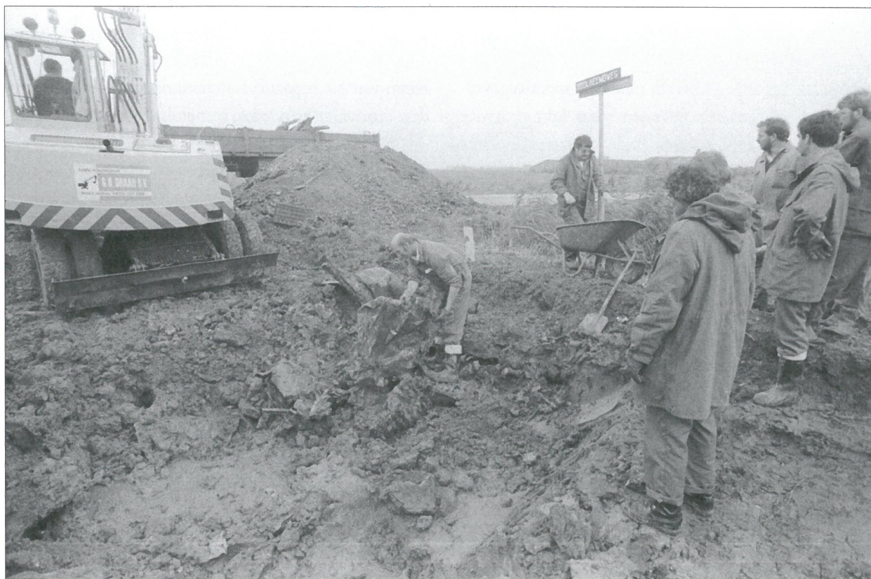
Graven in het verleden, een archeologische bezigheid waarbij veel handen het werk licht maken. Daarnaast heeft destijds de fotograaf, Ruud Rogier, zijn best gedaan geografische gissingen uit te sluiten. Met dank aan het Stadsarchief van de gemeente Oss.